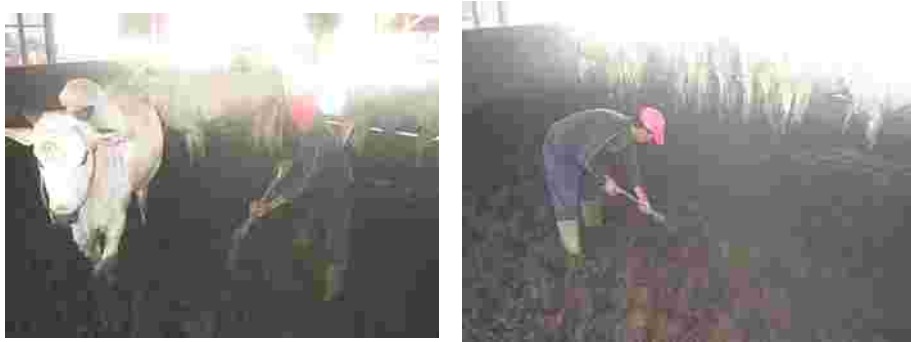
Gambar 2. Pemanenan kotoran sapi