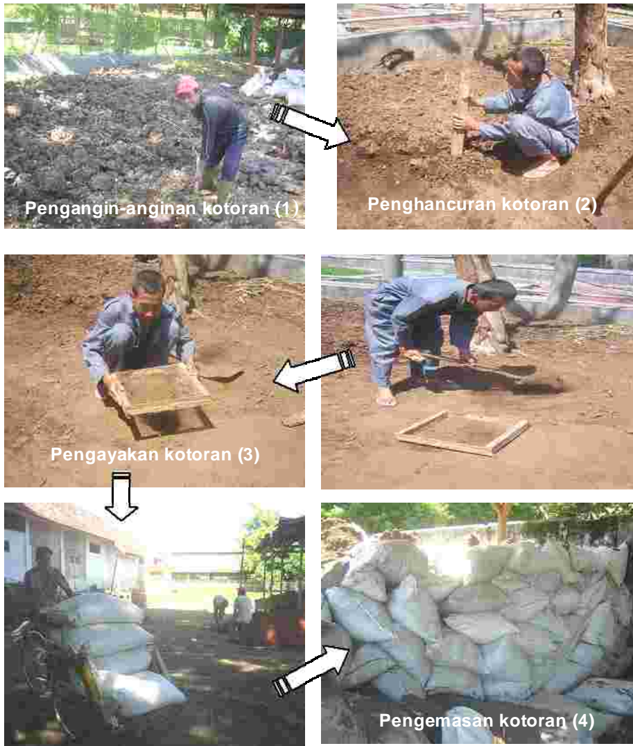
Gambar 3. Proses pembuatan kompos curah