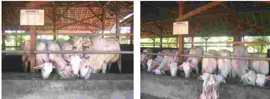
Gambar 1. Kandang sapi sistem kelompok