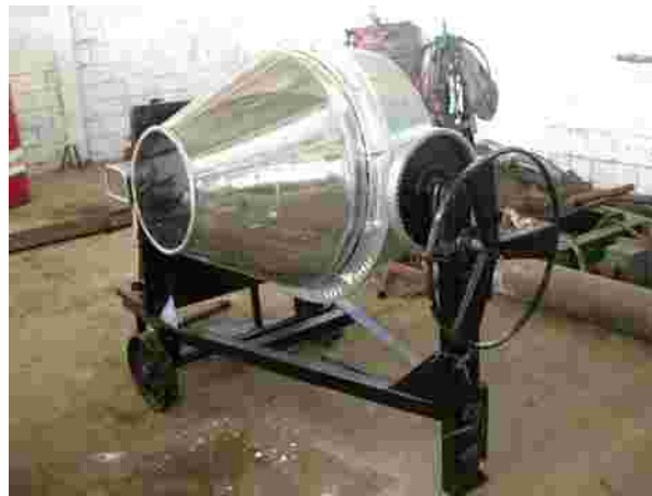
Gambar 6. Mesin granul